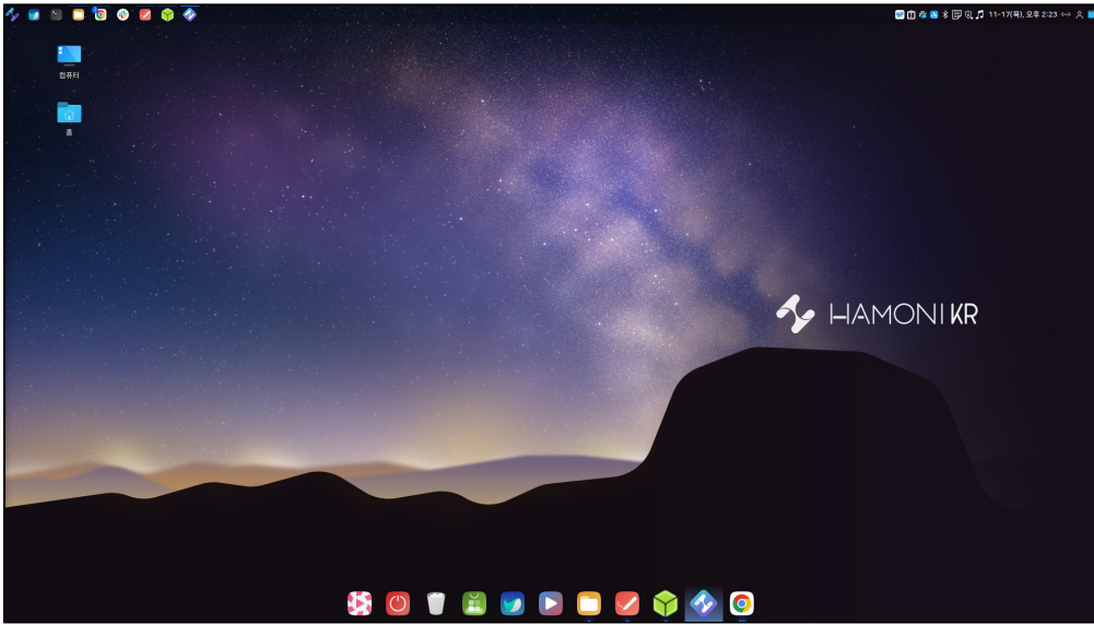
맥 스타일 테마 적용 화면